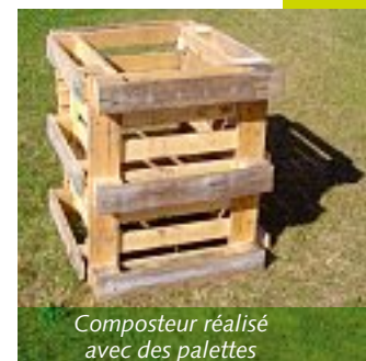
Composteur réalisé avec des palettes