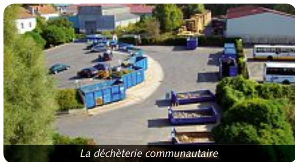
La déchèterie communautaire

La déchèterie est le lieu d'évacuation pour le recyclage et la valorisation des déchets qui ne sont pas collectés au porte à porte ou en apport volontaire.